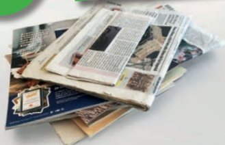
Giornali e riviste

SCHIACCIA E APPIATTISCI SCATOLE E SCATOLONI