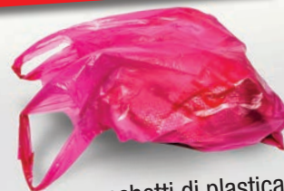
Borse e sacchetti di plastica