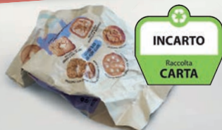
Confezioni in materiale misto con il simbolo carta