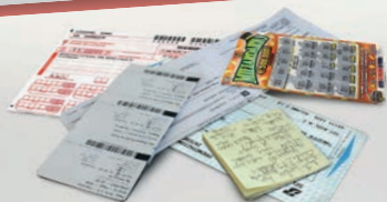
Post-it, gratta&vinci, bollette, biglietti cartacei, ricette mediche