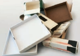
Scatole in cartone e cartoncino