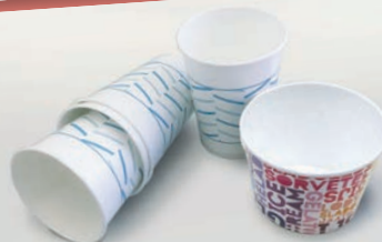
Coppette e bicchieri in carta