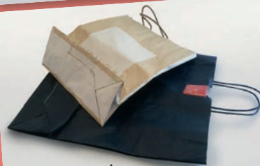
Borse in carta