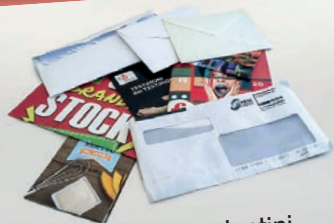
Buste, opuscoli e volantini