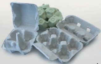
Confezioni per le uova in carta