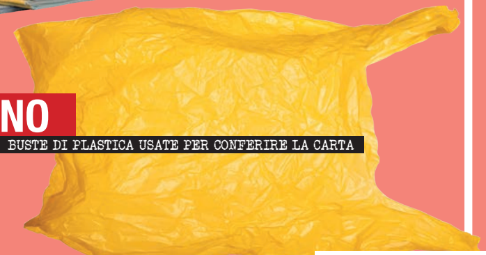
BUSTE DI PLASTICA USATE PER CONFERIRE LA CARTA

Fino ad ora siamo stati bravi, ma c'è da fare un passo in più: una raccolta di qualità, per una migliore qualità della vita.