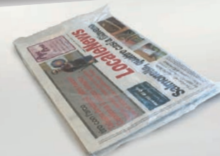
Riviste con cellophan