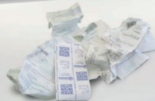
Scontrini in carta chimica/termica