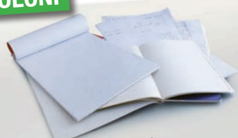
Quaderni, block notes e fogli di carta