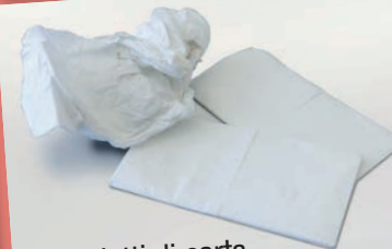
Fazzoletti di carta

e NO carta copiativa, carta plastificata, carta da forno, carta oleata, scatole o imballi con residui di cibo, carta contaminata da sostanze pericolose, imballi in plastica, piatti e bicchieri compostabili, carta da parati, polistirolo.