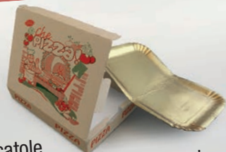
Scatole pizza e vassoi da pasticceria