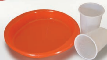
Piatti e bicchieri in plastica