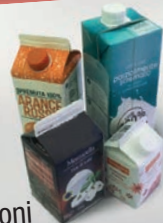
Confezioni alimentari in tetrapak