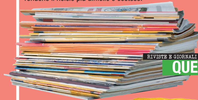
RIVISTE E GIORNALI

Nel nostro territorio la raccolta differenziata cresce sempre di più, ma c'è ancora uno sforzo da compiere: riconoscere i rifiuti che ci ingannano . Forse non lo sapete, ma ci sono alcuni materiali che messi nella carta rendono il riciclo più difficile e costoso.