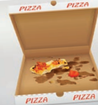
Scatola della pizza con residui